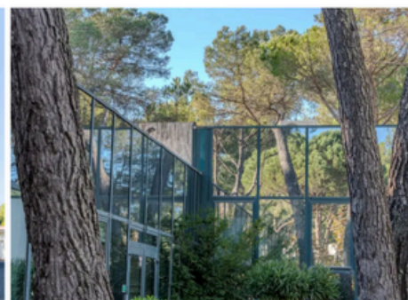
Campus de Nice/Sophia Antipolis 694 Avenue Maurice Donat 06250 Mougins - Sophia Antipolis