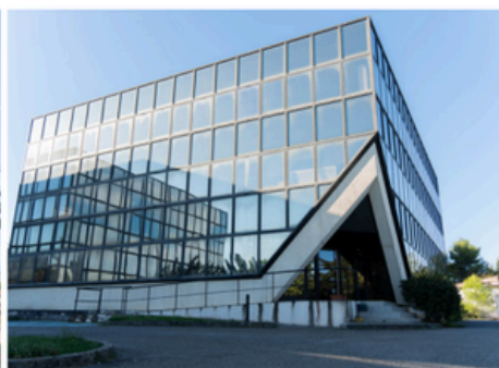
Campus d'Aix-en-Provence 100 rue Pierre Duhem 13290 Aix-en-Provence Les Milles