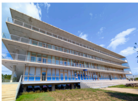
Campus d'Avignon 95c Allée Camille Claudel 84140 Avignon-Montfavet