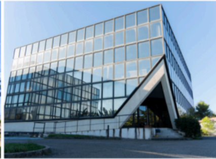
Campus d'Aix-en-Provence 100 rue Pierre Duhem 13290 Aix-en-Provence Les Milles