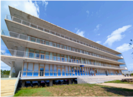
Campus d'Avignon 95c Allée Camille Claudel 84140 Avignon-Montfavet