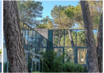
Campus de Nice/Sophia Antipolis 694 Avenue Maurice Donat 06250 Mougins - Sophia Antipolis